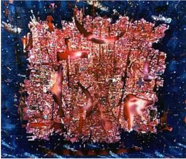
Vas cu panze rosie, batic, matase, 93x120, 1998