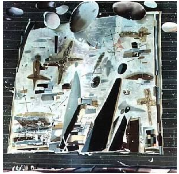
Perete, batic, matase, 90x100, 1994