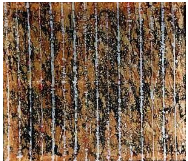
Toamna. Berlin, batic, matase, 80x90, 1999