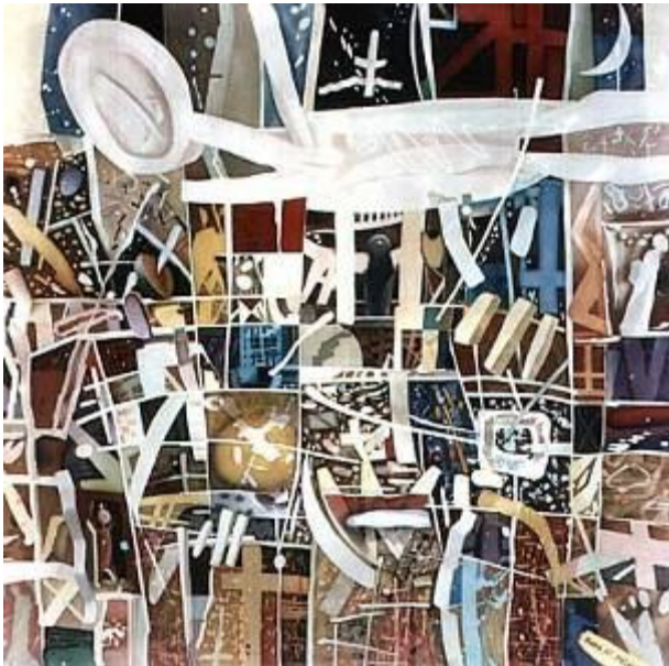
Craciunul, batic, matase, 90x90, 1994