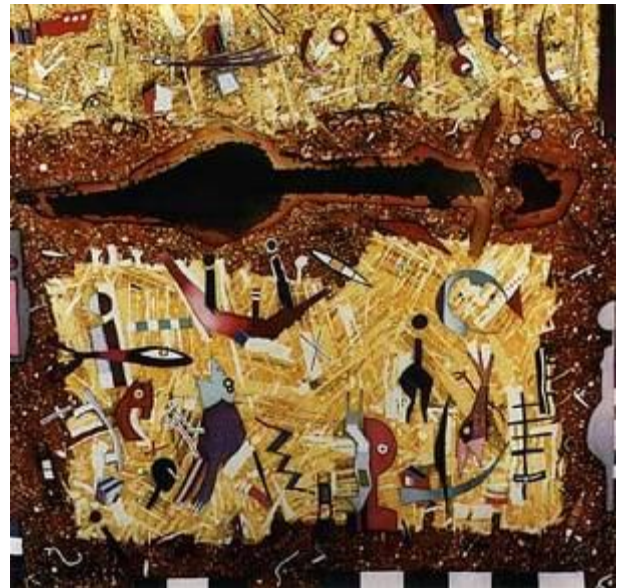
Insula, batic, matase, 90x100, 1997