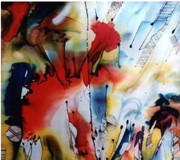
August, Struer, batic, matase, 80x90, 1999