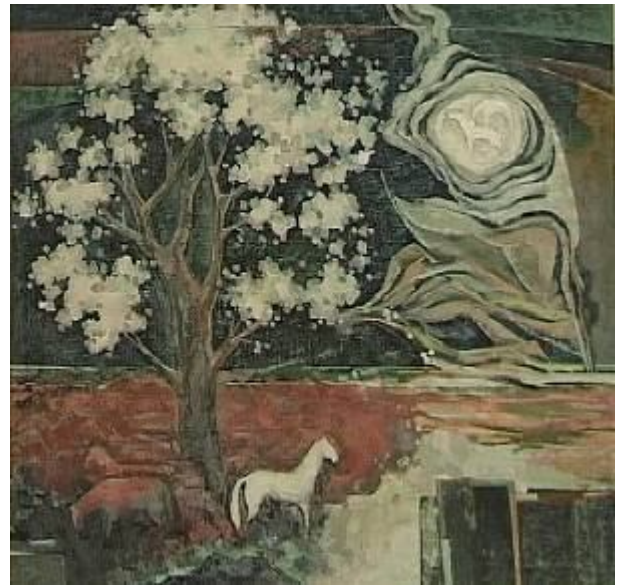
Muze, u/p, 81x69, 2001