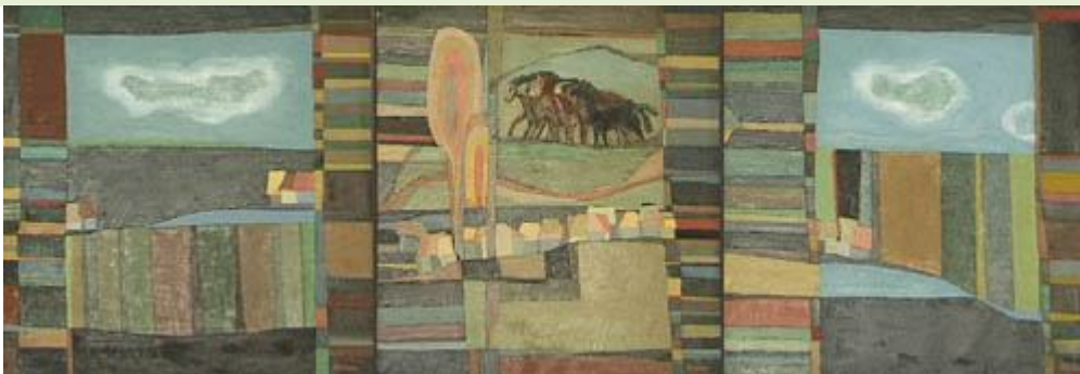
Triptic, Urme pe cer, u/p, 71x66, 65,5x65,5, 71x66, 2000