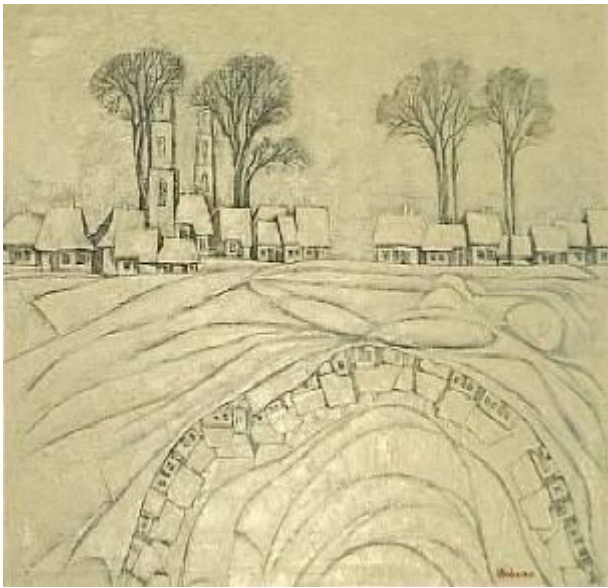
Sub scutul iernii, u/p, 73x65, 2001