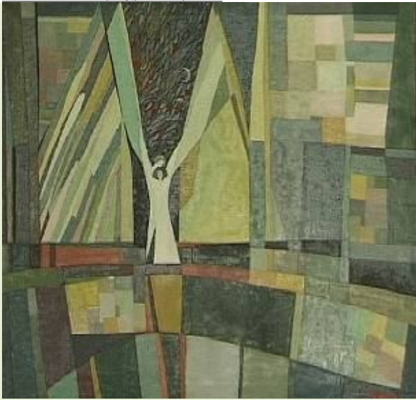
Vis interrupt, u/p, 73x65, 2000