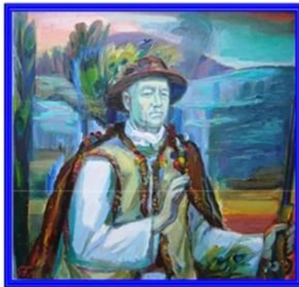
Ștefan Florescu. Visul tălăui meu la vînătoare în Codrul Cosminului. 1990. Ulei pe pînză, 850x850 mm