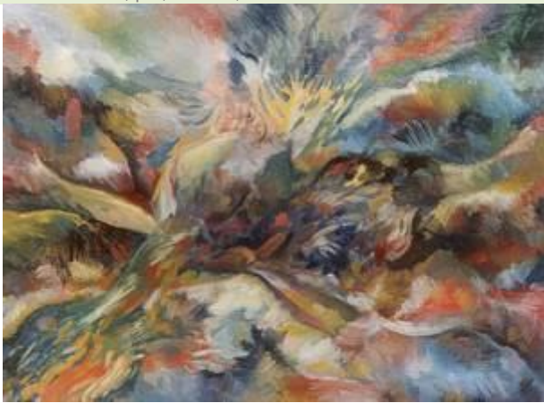
Cursul timpului, p/u, 120x90, 2000