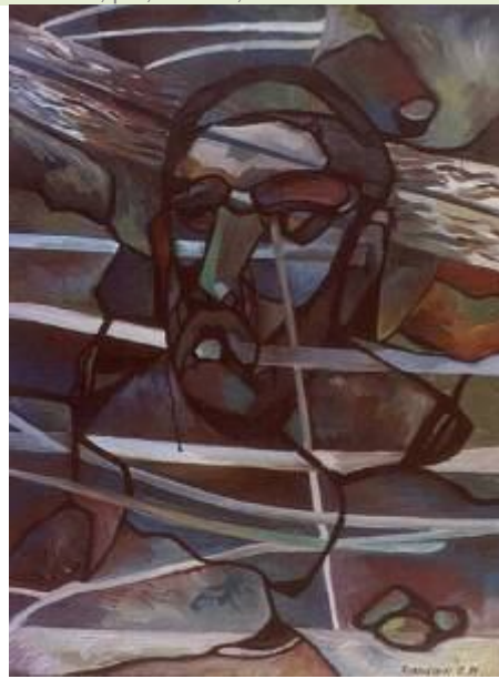
Ginduri, p/u, 60x40, 1999