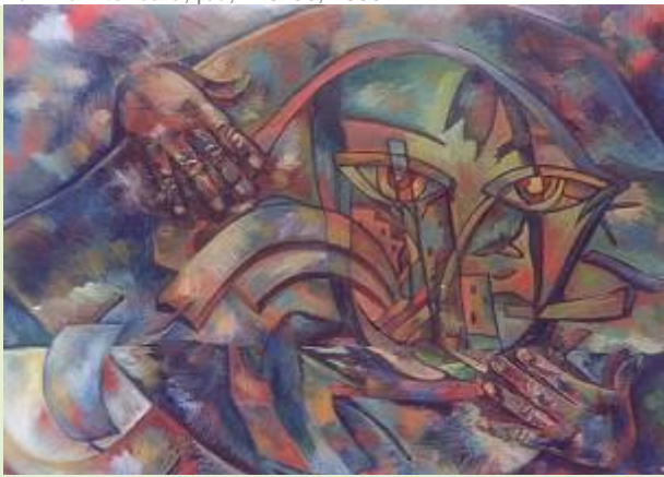
Velierul visului, p/u, 120x90, 2000