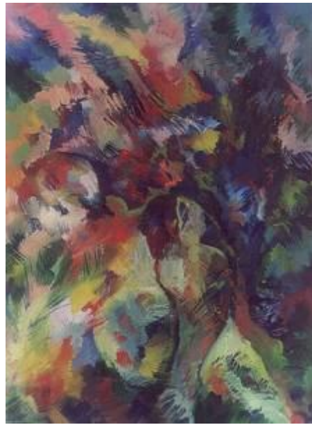
Umbre, p/u, 120x90, 2000