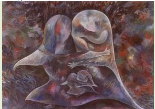
Sarutare, p/u, 120x90, 2000