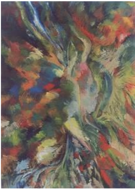
Lumina interioara, p/u, 120x90, 2000