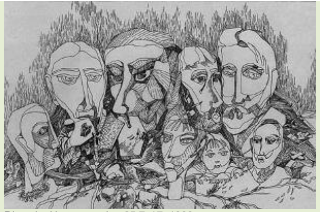
Dinastie, H., tus, penita, 25,7x17, 1999